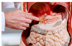
Erfahrung für Ihre Gesundheit