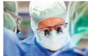
Modernste OP-Technik und Erfahrung

Eine weitere ambulante Therapie kann im Medizinischen Versorgungszentrum MVZ der ALB FILS KLINIKEN erfolgen. Die Nachsorgemaßnahmen übernimmt der Hausarzt in Zusammenarbeit mit den niedergelassenen Internisten und dem Pankreaskarzinomzentrum.